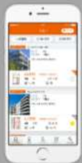
LIFULL HOME'S iOS・アンドロイドアプリ