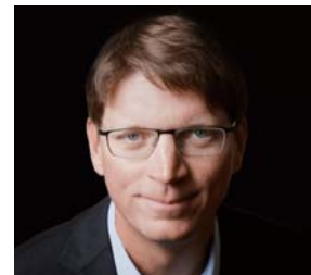
キーノートスピーカー ニクラス・ゼンストローム Atomico CEO / Skype 共同創業者