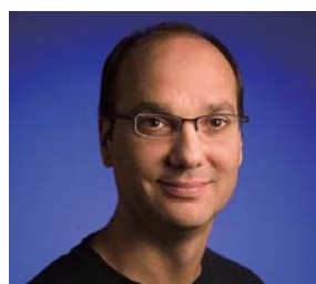
キーノートスピーカー アンディ・ルービン Google 上級副社長