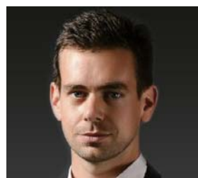
キーノートスピーカー ジャック・ドーシー Square 共同創業者・CEO/ Twitter 共同創業者