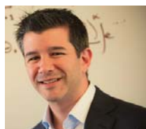
ゲストスピーカー トラビス・カラニック Uber Technologies, Inc. CEO