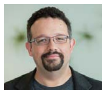
ゲストスピーカー フィル・リービン Evernote Corporation CEO