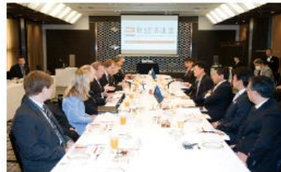
2014年3月6日 エストニア大統領と新経済連盟との意見交換会

イタリアでは法人設立登記に18ヶ月かかりますが、 エストニアでは18分 です。 役員全員のIDを入力すればいいからです。