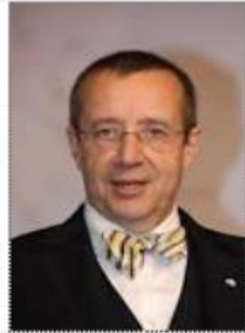
トーマス・イルヴェス大統領 (当時)

イタリアでは法人設立登記に18ヶ月かかりますが、 エストニアでは18分 です。 役員全員のIDを入力すればいいからです。