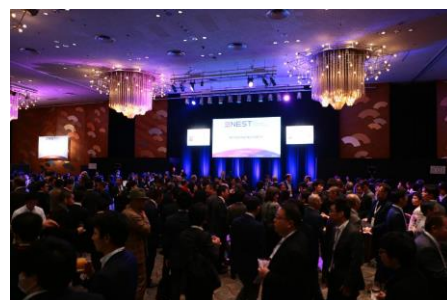
昨年開催(新経済サミット2016)時の様子

会期中は、ベストセラー『Hard Things』の著者ベン・ホロウィッツ氏や、世界中で5億人を超えるユーザー数を誇る人気オンラインストレージ「Dropbox」共同創業者のドリュー・ヒューストン氏、そして「世界で最もイノベティブな会社」に選ばれた世界的なデザインファーム IDEO のパートナーであるトム・ケリー氏らによる基調講演を始め、グローバルなイノベーション分野の第一線で変革をけん引するリーダー達によるパネルディスカッションが開催されます。